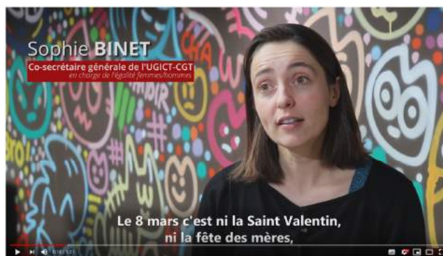
Le 8 mars c'est ni la Saint Valentin, ni la fête des mères.